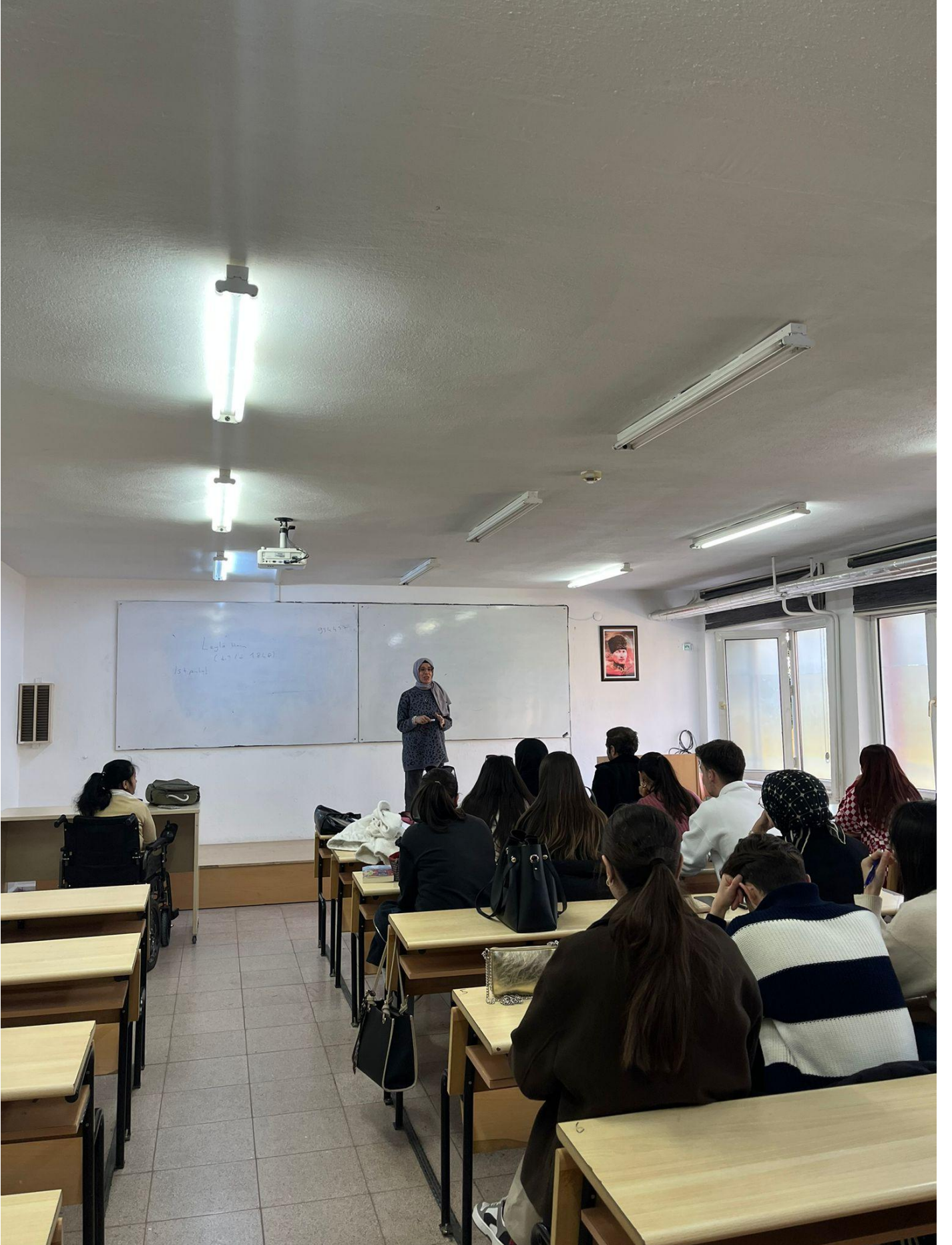
17.03.2026 tarihinde, saat 15:00'da, 120 numaralı derslikte Lisans 1. Öğretim 4. sınıf öğrencileriyle danışman toplantısı gerçekleştirildi.