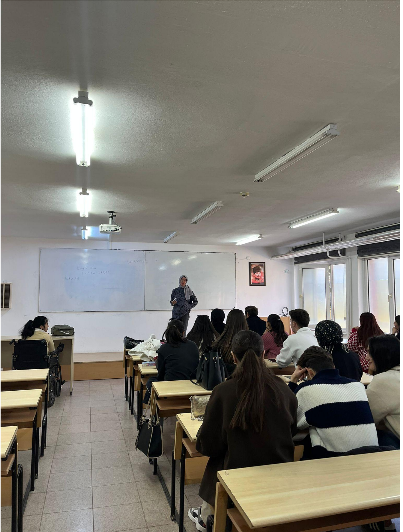
17.03.2026 tarihinde, saat 15:00'da, 120 numaralı derslikte Lisans 1. Öğretim 4. sınıf öğrencileriyle danışman toplantısı gerçekleştirildi.