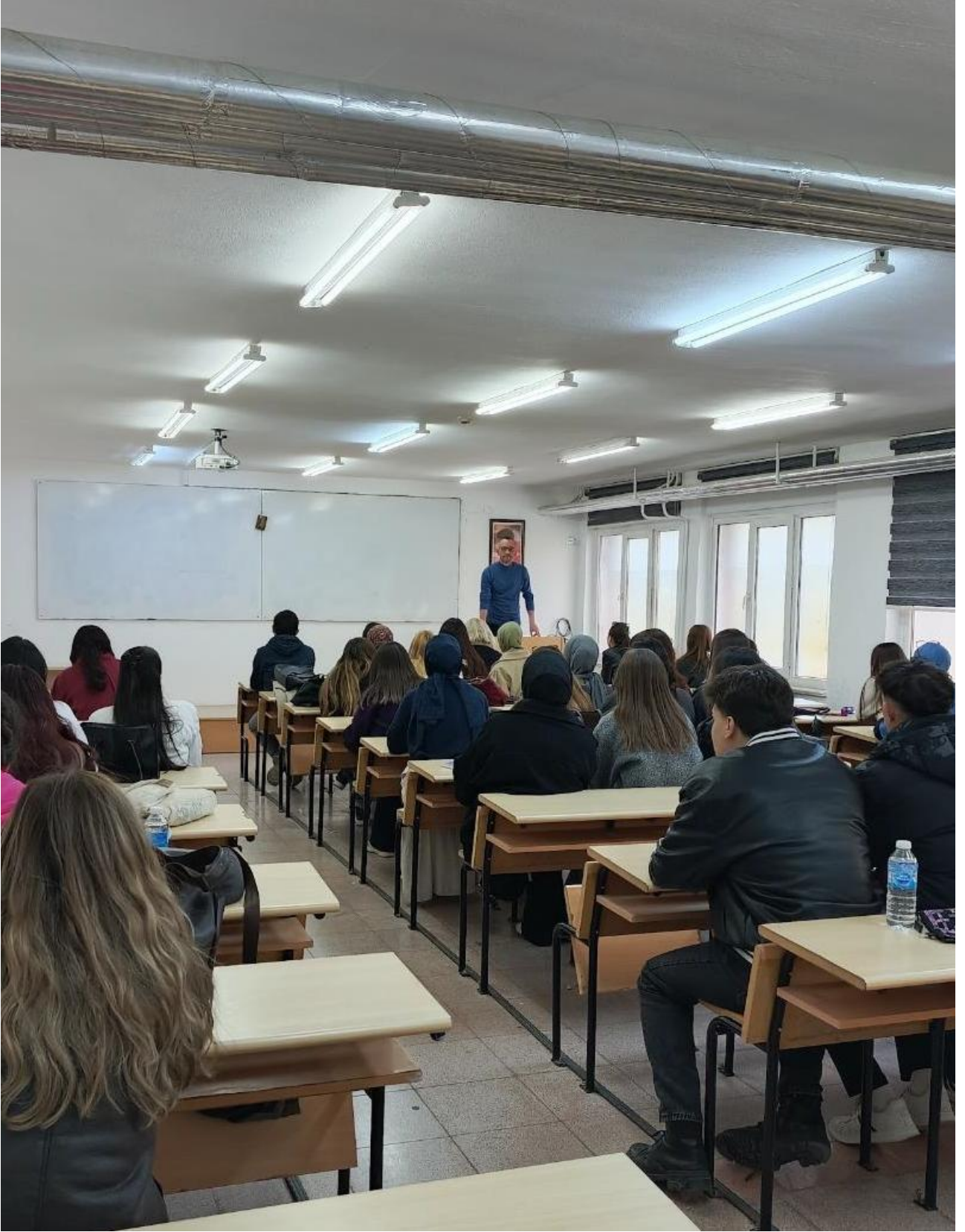
17.03.2026 tarihinde, saat 15:00'da, 120 numaralı derslikte Lisans 1. Öğretim 4. sınıf öğrencileriyle danışman toplantısı gerçekleştirildi.